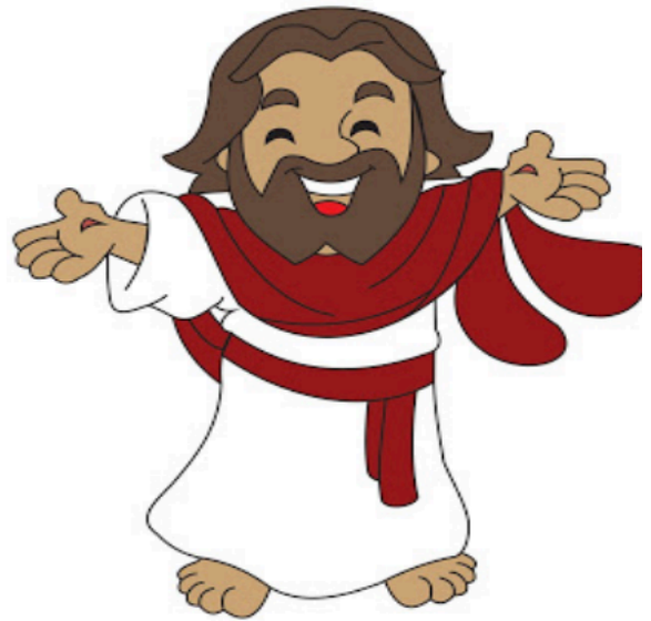
JESUS ( )