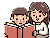
MINHA IRMÃ (MEU IRMÃO)