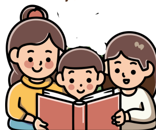
MAMÃE PODE LER PARA MIM