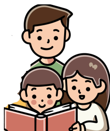
PAPAI PODE LER PARA MIM