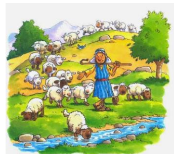
Para os pastores