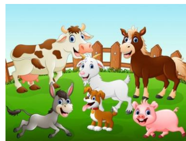
Para os animais

ORAÇÃO: Leia e a criança repete: “Deus, obrigado por Jesus ter nascido e ser nosso Salvador!”